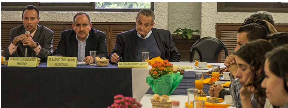
Presentación de la campaña Piñata de Libros 2016.

Uno de los objetivos principales este año es lograr que más gente conozca la librería permanente más grande de América Latina y trabajar arduamente en